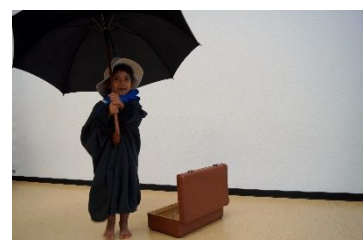
Mit Schirm und Koffer