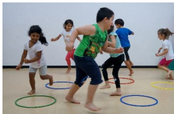
Komm in mein Haus