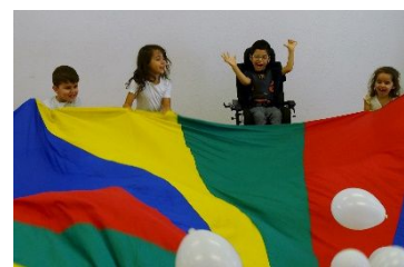
Mit ganz viel Schwung